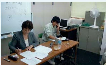
ロールプレイング